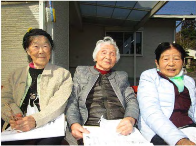
3人様いつも仲良しで素敵ですね～