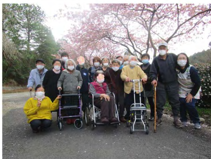
「綺麗だね」と言われながら梅の花をバックに笑顔で記念写真を撮る利用者様と職員